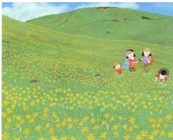
「高原の花」1983年 ©原田泰治