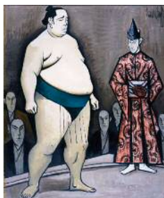
《相撲 睨み合い》1987 油彩