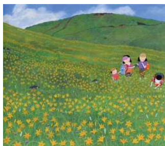
「高原の花」1983 年 © 原田泰治