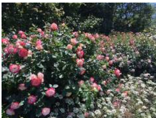
クレマチスとバラの競演