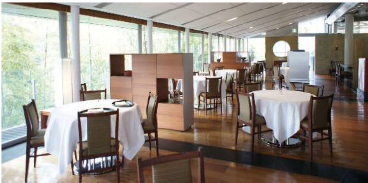
日本料理【テッセン】