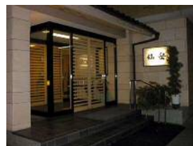
原田泰治おすすめの割烹 仙岳